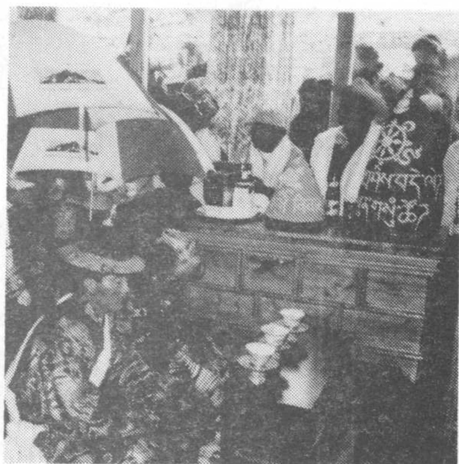
Bride and groom kneel at a Sherpa Buddhist wedding. Cone-shaped wedding cakes are in upper right.

Chapman and Avery also presented slides and audiotape of a Sherpa Buddhist wedding and pre- and post-nuptial parties they had been invited to attend.