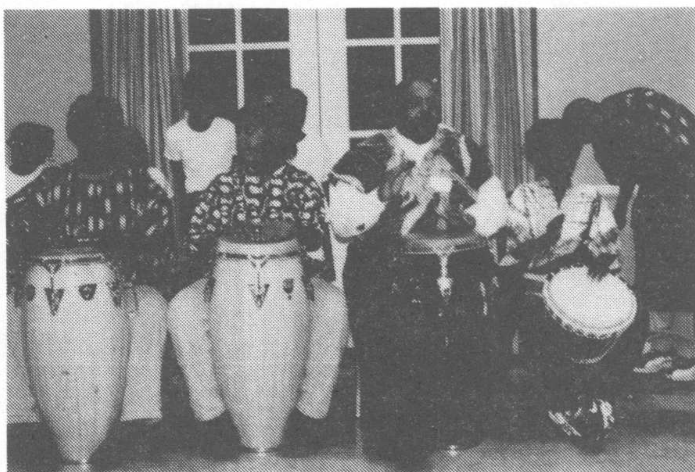
Short Stop Drum and Dance Ensemble

Highlights of the evening included a delicious Ethiopian dinner catered by the Blue Nile Restaurant. A variety of entrees were served to an enthusiastic group of more than 100 attendees in COSI's Grand Hall.